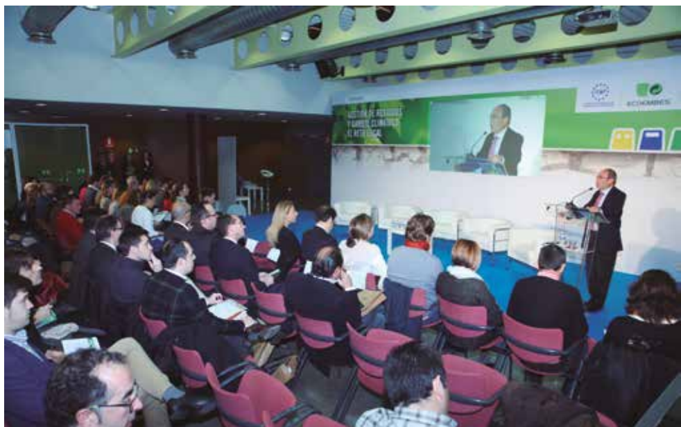
El Alcalde de Fuenlabrada, en la Jornada de la FEMP y Ecoembes.

Por su parte la Directora General de Calidad y Evaluación Ambiental y Medio Natural del Ministerio de Agricultura, Alimentación y Medio Ambiente, Guillermina Yanguas, puso el acento en la importancia del avance en Europa de la aplicación de la economía circular, en la que todos los recursos se utilizan, para lograr mayor eficiencia y competitividad.