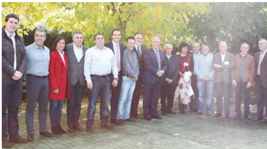
Nueva Comisión Ejecutiva de la Federación Riojana de Municipios.

La Federación Riojana de Municipios (FRM) también ha renovado sus órganos de gobierno. Continúa como Presidente el Alcalde de Huércanos,