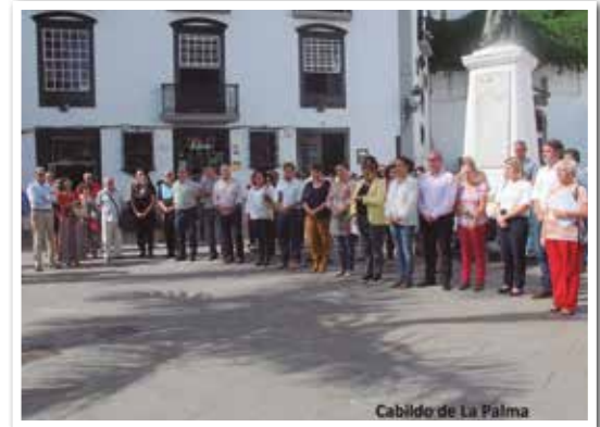
Cabildo de La Palma