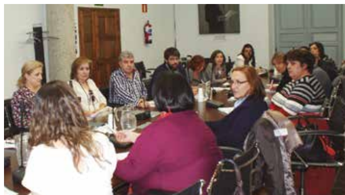
Uno de los grupos de trabajo que se formaron durante la Jornada.