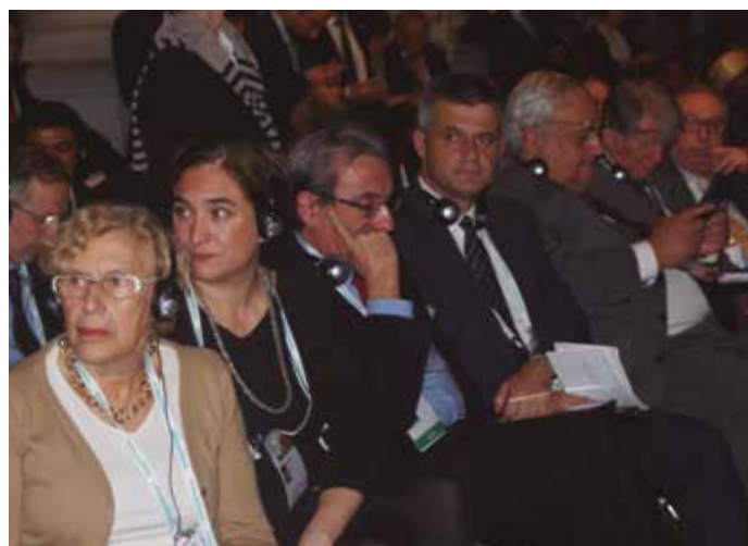
Alcaldes españoles en uno de los encuentros.