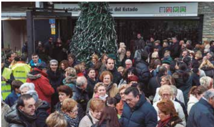
La Bruja de Oro, uno de los símbolos de la Lotería Nacional.