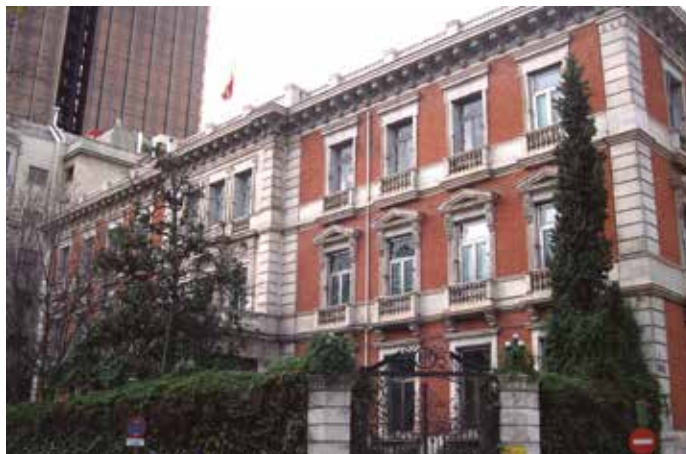
Desde el MINHAP se remitió una carta en la que se informaba sobre el mantenimiento de la competencia.

teniendo esta misma postura reivindicativa, alertando del “caos social” al que se enfrentará nuestro país si el próximo uno de enero los Ayuntamientos dejan de prestar servicios sociales a los ciudadanos. ★