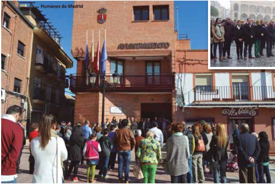
Humanes de Madrid