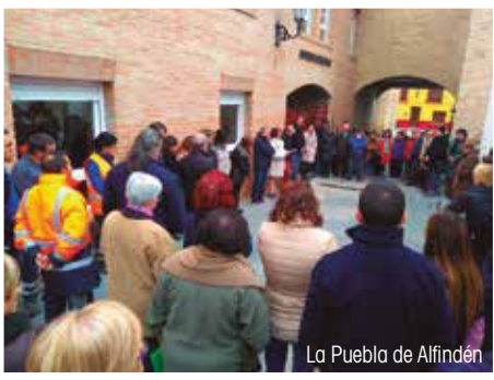
La Puebla de Alfindén