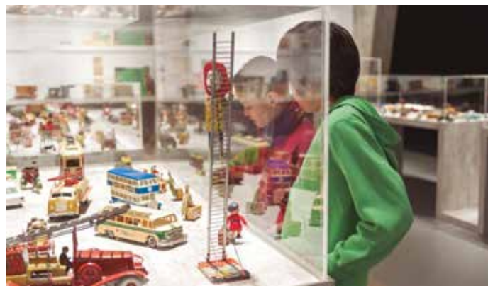
Museo del Juguete de Ibi.

En palabras de Rafael Serralta, Alcalde de Ibi, gran conocedor del sector por haberse dedicado a la industria del juguete antes de entrar en política, "lo que hoy es Ibi se lo debe indudablemente al juguete. Nos encontramos en el puesto 136 del ranking de peso industrial de España y actualmente el juguete constituye un 17% de la facturación. El negocio del