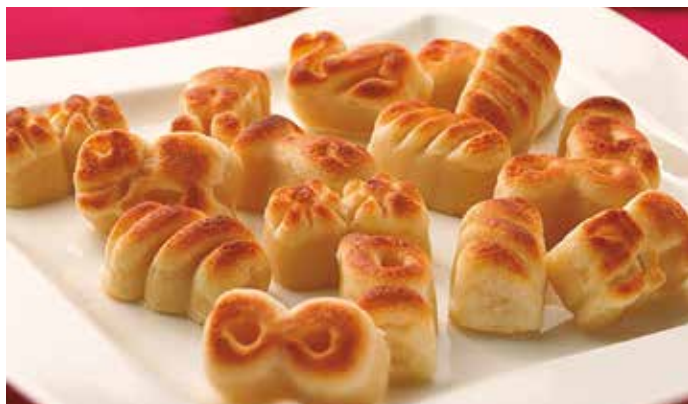
El mazapán lleva el nombre de Sonseca a todos los rincones de España.

De los 11.000 habitantes que tiene Sonseca aproximadamente mil trabajan en la producción de turrónes, mazapanes y otros productos típicos navideños, lo que significa el 15% de la población activa. Sonseca tiene además su propio Museo del Mazapán, propiedad de Delaviuda, que organiza visitas a la fábrica para mostrar, a través de sus grandes pasillos acristalados, la elaboración del mazapán de ayer y de hoy.