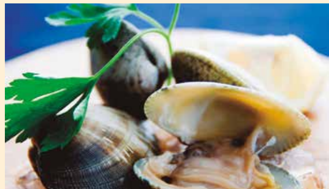
Las almejas de Carril, otro de los productos tradicionales de estas fechas.