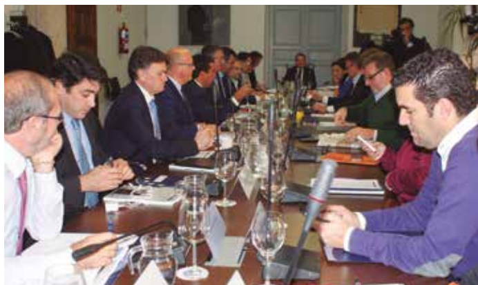
Reunión de la Junta de Gobierno del FEMP el pasado noviembre.

Paralelamente, numerosos trabajadores sociales vinculados a los servicios municipales perderían su ocupación al dejar de ejecutarse los programas en este ámbito que, lógicamente, y al no ser competencia municipal, carecerían de partida asignada al efecto, que no quedaría consignada en los presupuestos municipales de 2016.