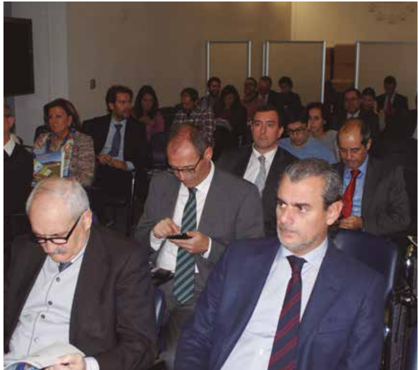
A la jornada acudieron medio centenar responsables de urbanismo y medio ambiente en Ayuntamientos españoles.

En España, son ya 4.600 vehículos los que circulan con gas natural, fundamentalmente autobuses en un 40% y camiones de recogida de residuos en un 29%; y en total 21 provincias, entre las que se encuentran Madrid, Barcelona, Sevilla y Valencia, disponen ya de suministro de estaciones públicas. ★