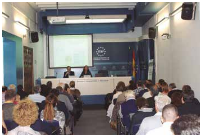
Sesión inaugural de la Jornada celebrada en la sede de la FEMP.

Con la finalidad de proporcionar a las Administraciones Locales información y herramientas para la puesta en marcha de medidas que contribuyan a mejorar la eficiencia energética en el parque edificado, a partir de un mejor conocimiento de la legislación en vigor y para dar a conocer las herramientas elaboradas conjuntamente, se van a celebrar, en principio, otras dos Jornadas divulgativas: en Vigo, el 21 enero de 2016; y en Málaga en fecha pendiente de concretar. ★