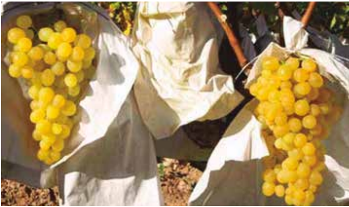
Las uvas de Vinalopó tienen unas cualidades singulares.

Según los cálculos del Consejo Regulador, que agrupa a entre 600 y 700 agricultores del Vinalopó, la producción de uva Aledo se sitúa en esta campaña en torno a 22 millones de kilogramos, de los que 2 millones se ingerirán con las doce últimas campanadas de 2015.