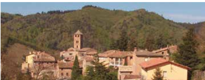
Espinelves es el principal productor de árboles de Navidad de toda España.

Para dar a conocer todas las posibilidades y recursos de este pueblo se creó hace más de tres décadas la Feria del Abeto. Desde entonces ha ido creciendo año tras año hasta convertirse en la segunda feria de Navidad más importante de Catalunya en cuanto a número de visitantes y una de las más antiguas que se realizan durante estas fechas. En ella se ofrecen, además de una gran variedad de abetos, distintos productos naturales y gastronómicos. La edición de este año tuvo lugar entre el 5 y el 13 de diciembre y se calcula que por ella han pasado más de 70.000 personas. ★