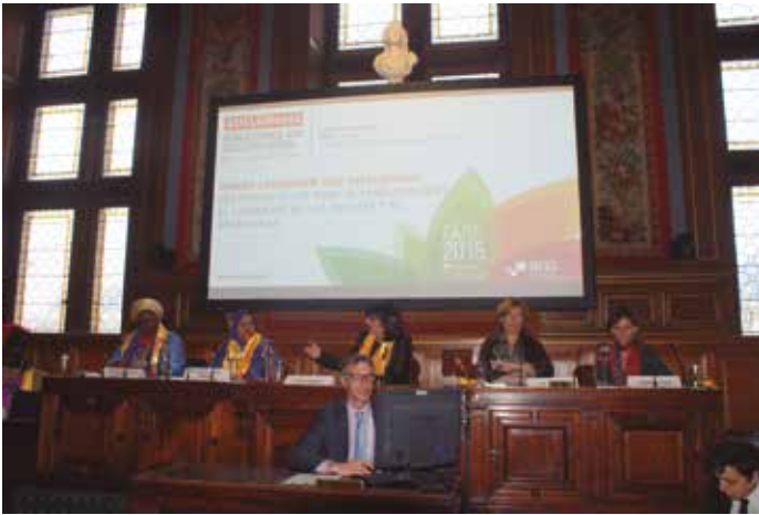
Reunión del Buró del CMRE

"para demostrar el amplio abanico de posibilidades de que dispone nuestro colectivo para llevar a cabo soluciones prácticas, a fin de atenuar el cambio climático y de adaptarse a él, así como de potenciar un desarrollo sostenible junto con una fuerte dimensión social basada en la participación de la ciudadanía".