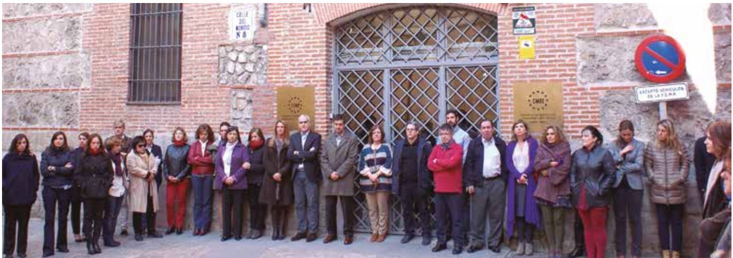
Minuto de silencio a las puertas de la FEMP.

Hoy, juntos, a las puertas de todos los Ayuntamientos de España, decimos bien alto: Todos Somos París".