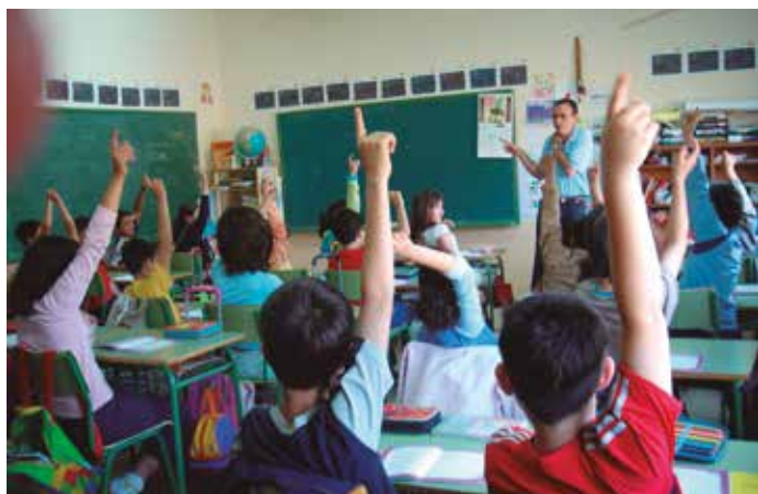
Los servicios sociales que prestan los Ayuntamientos podrían verse afectados, así como la atención a los menores.

A lo largo de las semanas siguientes, se remitió de nuevo a la FEMP la interpretación del Abogado del Estado respecto a la entrada en vigor