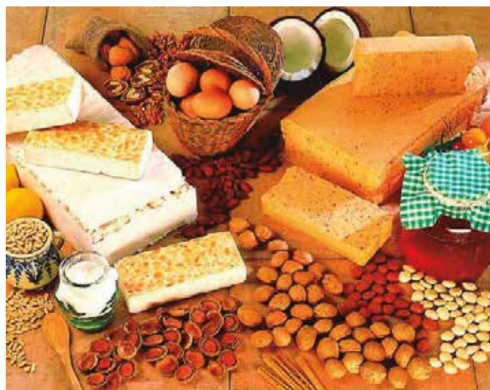
El Ayuntamiento de Jijona organiza múltiples actividades para la promoción del turrón.

Desde el Ayuntamiento de este municipio se organizan durante el año múltiples actividades para su promoción. Entre ellas destaca la Feria de Navidad de Jijona, que este año ya ha celebrado su VII edición. En este evento, que tuvo lugar entre el 5 y el 8 de diciembre, hubo expositores de turroneiros y dulces, expositores de la Asociación de Comerciantes y Empresarios de Jijona, expositores gastronómicos, artesanos y expositores de otras asociaciones de la localidad.