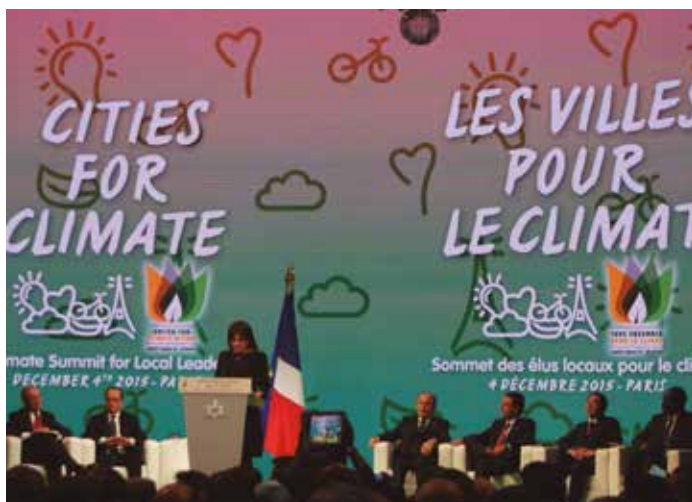
Anne Hidalgo, Alcaldesa de París, en una de sus intervenciones.

En términos generales, y según quedaba manifiesto en las declaraciones de las asociaciones municipalistas internacionales, la presencia local en eventos de esta naturaleza es especialmente relevante