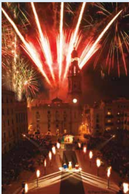
La Cabalga de Reyes Magos de Alcoy tiene sus orígenes en 1866.

Durante la Feria las opciones para conocer Jijona han sido muy variadas, desde la realización de talleres para niños y no tan niños, degustaciones y demostraciones gastronómicas, atracciones infantiles, visitas guiadas por el casco antiguo y diversas actuaciones.