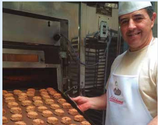
Estepa se transforma en una ciudad que vive por y para los Mantecados y Polvorones.

Además, de agosto a diciembre, los fabricantes locales proporcionan empleo directo a más de 2.000 personas, aparte de los que generan las sinergias económicas con distribuidores, proveedores de materias primas o imprentas.