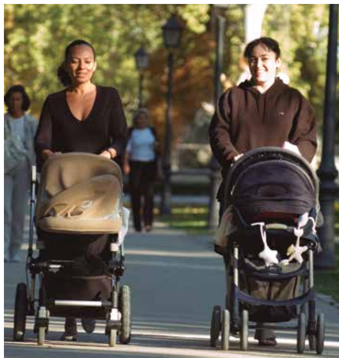
Como se puso de manifiesto en el desarrollo de la Jornada, el protagonista de la ciudad debe ser siempre el peatón.

Además, se explicó la metodología para trabajar en planes y proyectos de accesibilidad en vías y espacios públicos; la rehabilitación de cascos históricos en clave de accesibilidad; y la accesibilidad multisensorial en el diseño de espacios públicos urbanos. ★