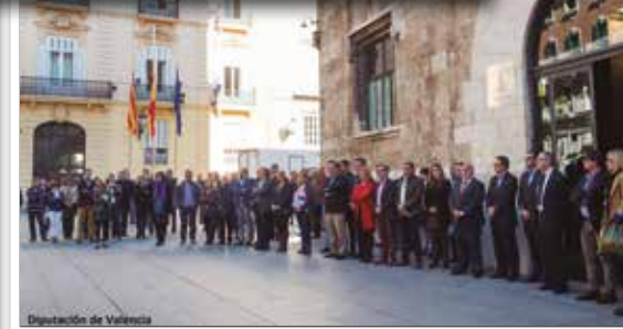
Diputación de Valencia